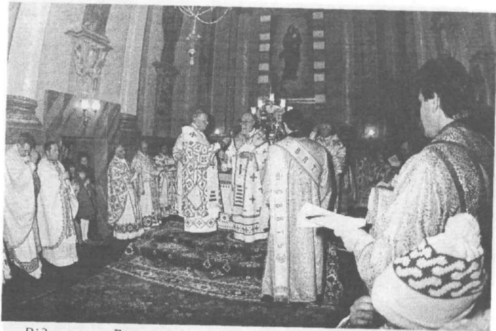
Відправляє Блаженніший Мирослав Іван, м. Збараж, 1991 р.