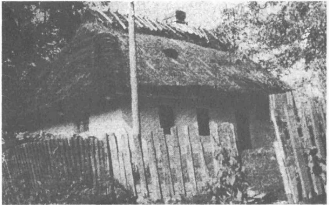
І звідси я прийшов на світ