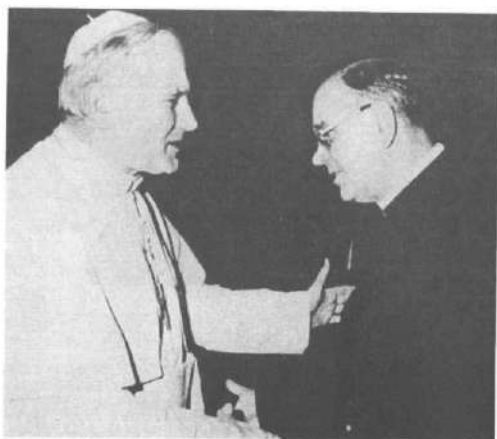
Аудієнція в Папи Івана Павла II. Рим, 1983 р.