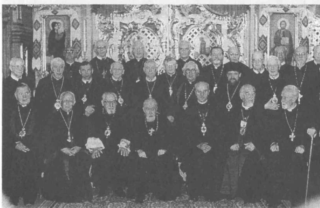
Синод єпископів на рідній землі, 1991 р.