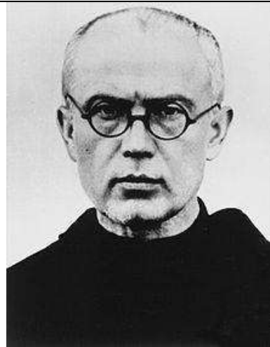
Максиміліан-Марія (в миру – Раймунд) Кольбе (8.01.1894-14.08.1941)

Метою дослідження є з'ясувати, чи мали дон Боско і отець Кольбе послідовників і як їх діяльність вплинула на духовно-моральний і соціальний розвиток суспільства, в якому вони жили.