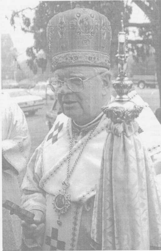
Фото 1. Владика Іван Прашко (1914–2001).