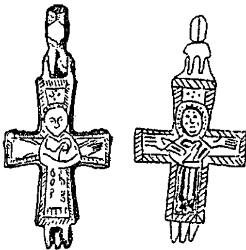
Хрести-енколпіони сирійсько-візантійського типу (VII–X ст.), знайдені в князюму Галичі (зліва) і літописному Васи́леві (справа)

німб з перехрестям та монограмами «ІС» та «ХС». На енкалпіонах такого типу обабіч постаті Христа розміщені написи, які читаються: «Хрест нам похвала» або «Хрест нам утіха». У верхньому і нижньому медальйонах є поясні зображення святих. Святий у верхньому медальйоні тримає у лівій руці закриту книгу, а правою благословляє. По обидві сторони від фігури є напис, який читається за двома літерами «Н» і «К», що це зображення святого Миколая. У нижньому медальйоні, на подібному енкалпіоні з Мстиславля (Білорусь) дуже чітко виднілося зображення святого Георгія.