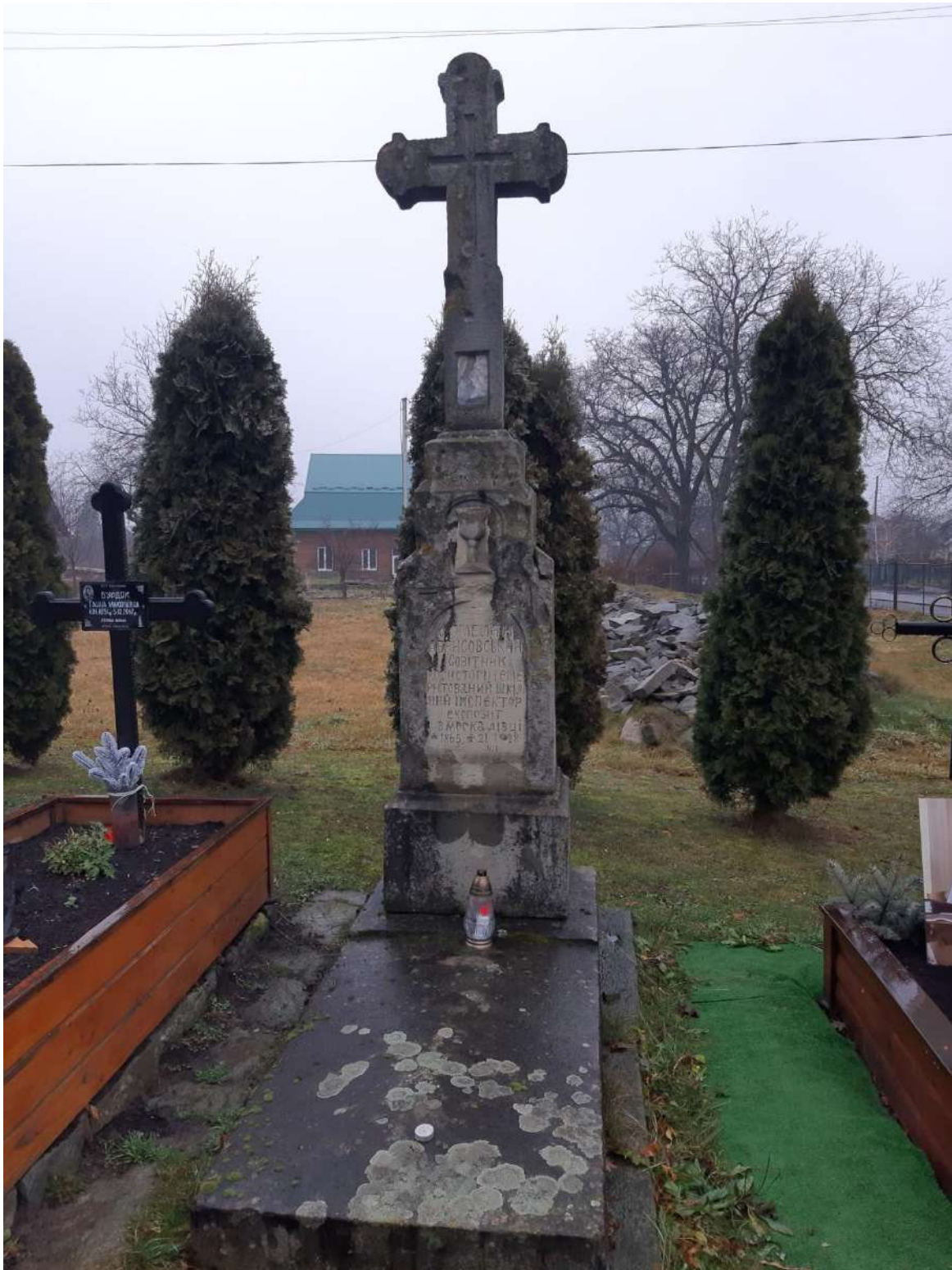
Фото № 1: Могила о. Омеляна Абрисовського (1865–1928) у присілку Москалівка міста Косів Косівського району Івано-Франківської області. дата фотографування – 23 грудня 2025 року 5 .