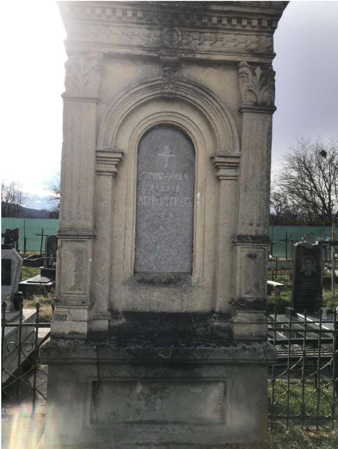
Фото № 2: Родинний гробівець Абрисовських у присілку Москалівка міста Косів Косівського району Івано-Франківської області. дата фотографування – 25 березня 2024 року 6 .