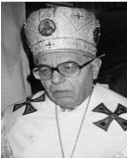
Фото № 7: Єпископ Филімон Курчаба (1913 – 1995).