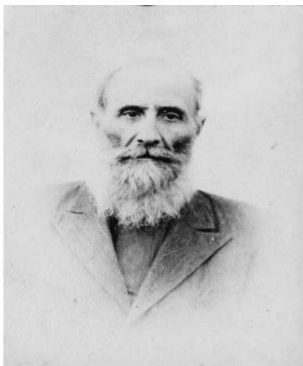
Фото № 2: Владика Миколай Чарнецький в останні роки ув'язнення