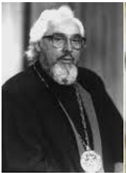
Фото № 8: Владика Павло Василик (1926 – 2004)