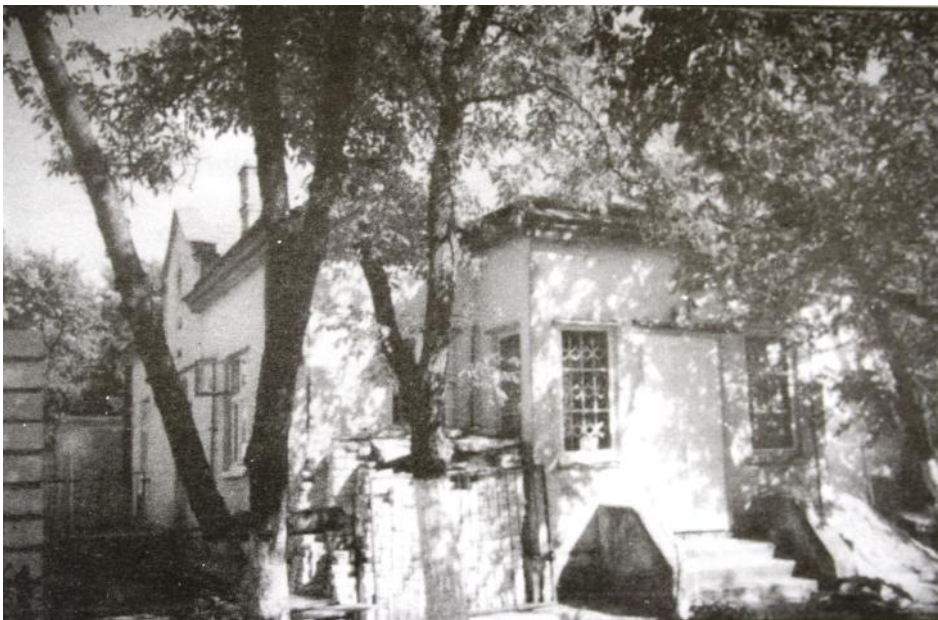
Фото № 6: Остання місце проживання владика Миколая Чарнецького (м. Львів, вул. Вечірня, 7)

Сестра Марія Пандрак, Згромадження Сестер Милосердя св. Вінкентія