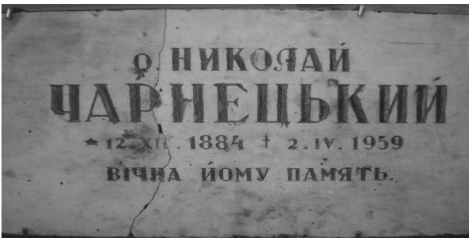
Фото № 13: Надмогильна дошка, Львів, початок 1960-х років.