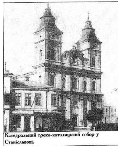
Катедральний греко-католицький собор у Станіславові.