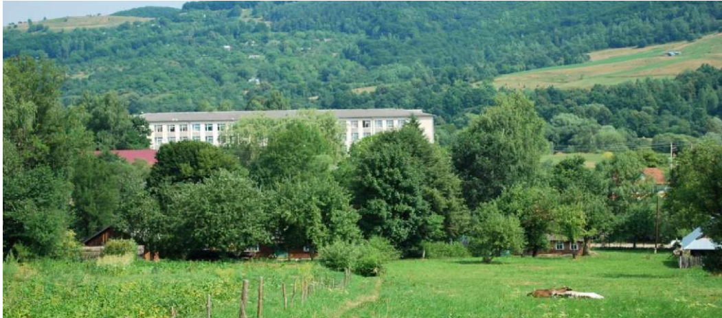
Середньоберезівська ЗОШ І-ІІІ ст., Косівського р-ну

Але злий рок перевертає усі його наукові плани, і він 26 серпня 1996 р. погоджується посісти посаду директора Середньоберезівської ЗОШ І-ІІІ ст.