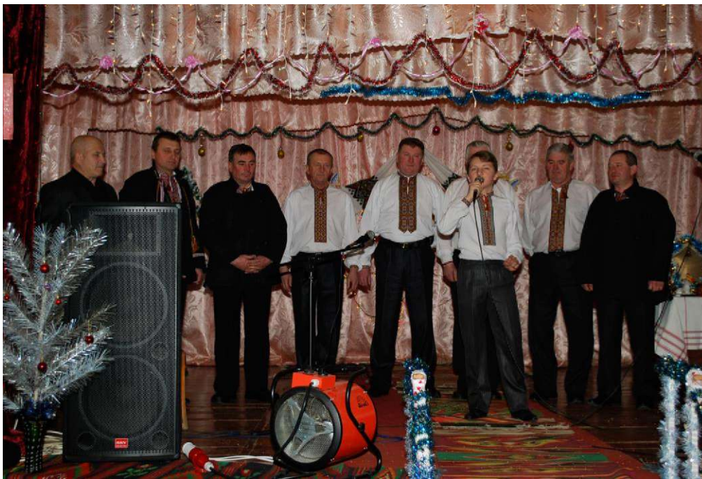
Чоловічий ансамбль с. Середній Березів виконує коломийки

березівських коломийок та відмінності їх звучання: від весільних до парубоцьких, від газдівських до жовнірських, а ще жартівливі, сумні, рекрутські, побутові - всі вони звучали в його виконанні відмінно й по-особливому, а ще запальніше - коли він із березунами їх співав і танцював стародавній танець «Березунку» (хорватську хору).