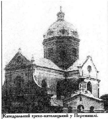
Катедральний греко-католицький у Перемішлі.