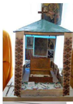
(ІВІВСЬКА ЦЕРКВА У СВІТІ) Азія. Країни колишнього СРСР