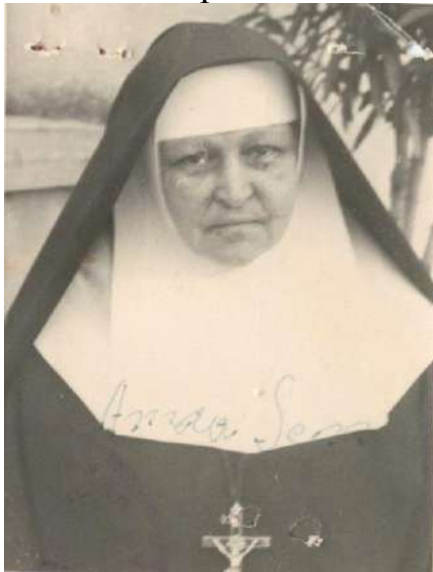
Фото: сестра Лонгина Абрагамович Згромадження Сестер Службниць Непорочної Діви Марії 174 .

В дитячому віці Ребека потайки відвідувала церкву в м. Галич, де познайомилася із монахинями – сестрами Службницями Непорочної Діви Марії з с. Кринос. Обряд хрещення прийняла та обрала нове ім'я Ольга 1903 у м. Галич з рук митрополита Андрія Шептицького разом із батьком, двома братами (Захарій-Сімха – Андрій; Мойсей – Ізидор), при цьому обряд хрещення відбувався під охороною поліції.