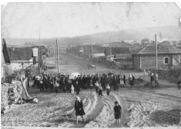
Фото № 10: Дорога до вічності на засланні.