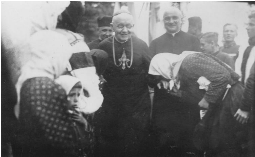
Фото № 14: Щира зустріч. Єпископ Григорій Хомишин та о. д-р Авксентій Бойчук.