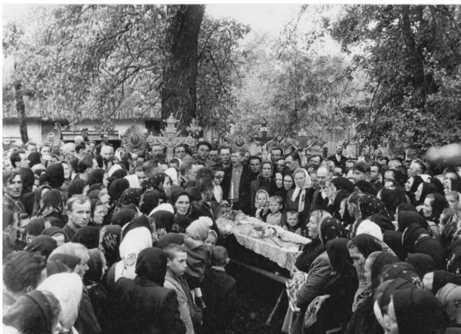
Фото № 16: Похорон катакомбного єпископа Симеона Лукача. с. Старуня, 1964 р.