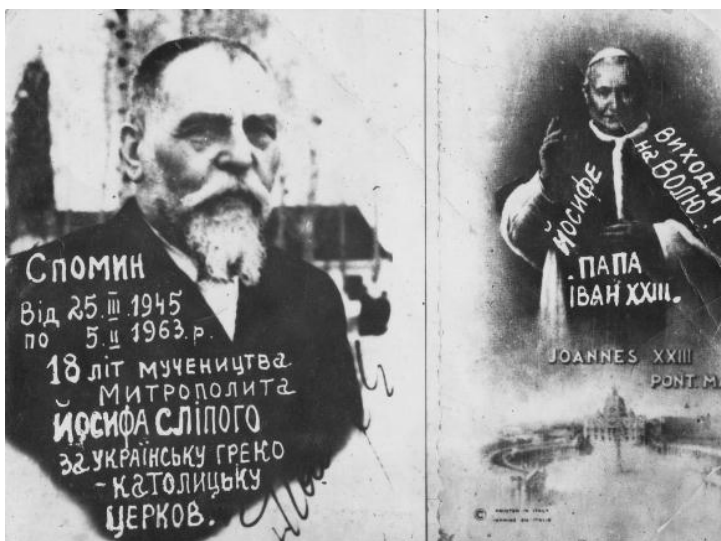
Фото № 15: Пам'ятна листівка. Митрополит Йосиф Сліпий. Папа Іван Павло II