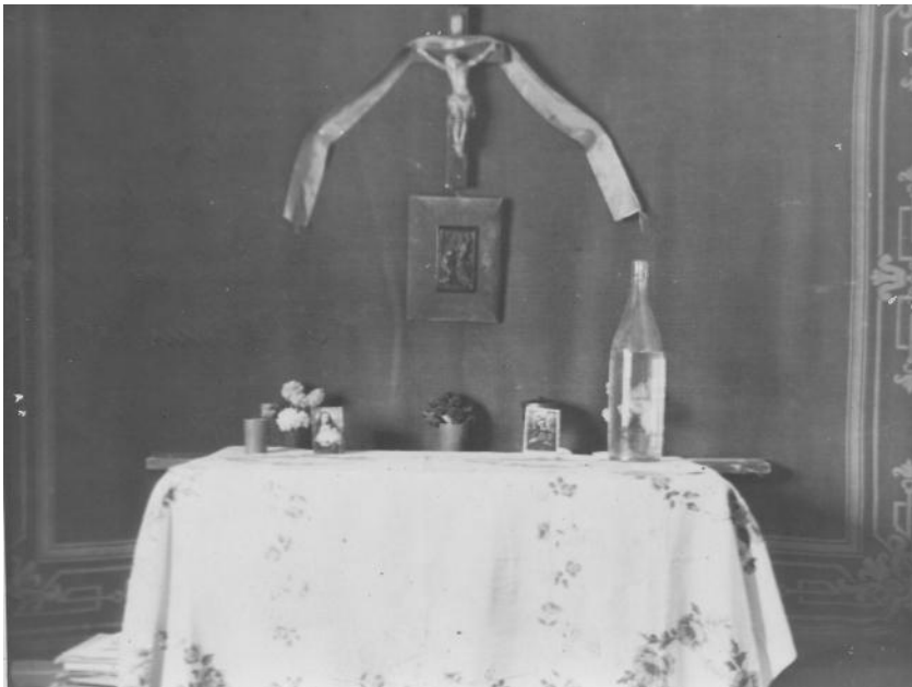
Фото № 19:

о. Ярослав Сірецький «на відпочинку» в Мордовії, 1961 р.