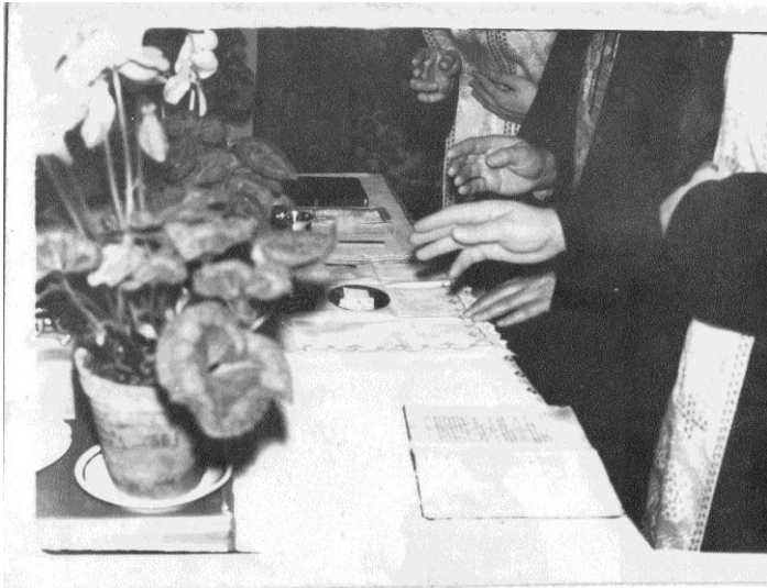
Фото № 13: «Катакомбна Літургія».