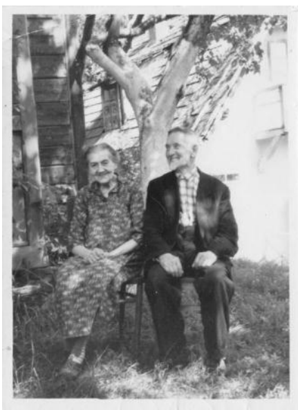
Фото № 1:

Окрема мова про передачу історичної епохи, адже етос, стиль життя історичної людини здатен рельєфно передати і ментальність історичної доби, її дух, самобутні ознаки, рівень технічного забезпечення. Але найголовніше, що фотодокументи випукло передають ментальність самих історичних людей. Часто практикуюча віра проглядається в обличчях людей, виразно проглядається оте потаємне, езотеричне, яке просто-напросто не вловлюється писемними документами.