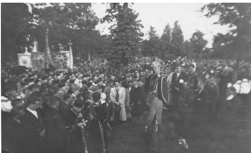
Фото № 12: Владика Іван Лятишевський виголошує проповідь під час перезахоронення жертв НКВС зі Станиславівської тюрми і тюремного подвір'я. Липень 1941 р.