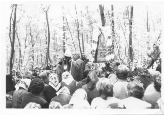
Фото № 9:

Після Місії Сидить в центрі єпископ Григорій Хомишин, провідник місії. с. Борщів біля м. Заболотів