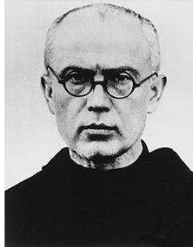
Максиміліан-Марія (в миру – Раймунд) Кольбе (8.01.1894-14.08.1941)

Метою дослідження є з'ясувати , чи мали дон Боско і отець Кольбе послідовників і як їх діяльність вплинула на духовно-моральний і соціальний розвиток суспільства, в якому вони жили.